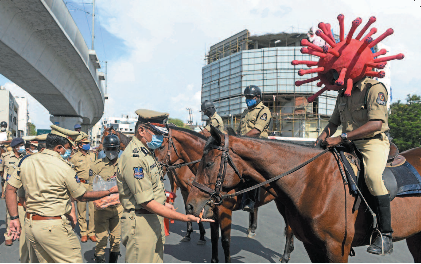
ಕೋವಿಡ್ ಕುರಿತು ಸಾರ್ವಜನಿಕರಲ್ಲಿ ಜಾಗೃತಿ ಮೂಡಿಸಲು ಕೊರೋನಾ ವೈರಸ್ ಮಾದರಿಯ ಹೆಲ್ಮೆಟ್ ಧರಿಸಿರುವ ಹೈದರಾಬಾದ್‌ನ ಅಶ್ವಾರೋಹಿ ಪೊಲೀಸ್.

ಭಾರತದಲ್ಲಿ ದ್ವಿಚಕ್ರ ವಾಹನ ಹೊಂದಿರುವುದು ಸಾರ್ವಜನಿಕ ಸಾರಿಗೆ ವಾಹನಗಳ ಅವಲಂಬನೆಗಿಂತ ಹೆಚ್ಚು ಅನುಕೂಲಕರ ಎಂಬ ನಂಬಿಕೆ ಇದೆ. ಹೀಗಾಗಿ ವಾಹನಗಳ ಸಂಖ್ಯೆ ವಿರೇಕಿಯಿಂದ ರಸ್ತೆಯಲ್ಲಿ ಅಪಘಾತಗಳ ಸಂಖ್ಯೆಯೂ ಏರುಮುಖವಾಗಿದೆ. ದ್ವಿಚಕ್ರ ವಾಹನಗಳ ಅಪಘಾತದಲ್ಲಿ ಹೆಲ್ಮೆಟ್ ಇಲ್ಲದಿರುವುದೇ ಅಪಾಯಕ್ಕೆ ಬಹುದೊಡ್ಡ ಕಾರಣ ಎಂಬುದು ಹಲವು ಪ್ರಕರಣಗಳಲ್ಲಿ ಸಾಬೀತಾಗಿದೆ. ಹೀಗಾಗಿ ಸರಿಯಾದ ಮತ್ತು ಹೆಚ್ಚು ಸುರಕ್ಷಿತ ಹೆಲ್ಮೆಟ್ ಆಯ್ಕೆ ಹೇಗಿರಬೇಕು ಎಂಬುದೂ ಒಂದು ದೊಡ್ಡ ಪ್ರಶ್ನೆ.