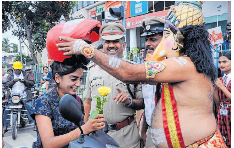
ಬೆಂಗಳೂರಿನಲ್ಲಿ ನಡೆದ ರಸ್ತೆ ಸುರಕ್ಷತಾ ಕಾರ್ಯಕ್ರಮವೊಂದರಲ್ಲಿ ಯುವತಿಗೆ ಹೆಲ್ಮೆಟ್ ತೊಡಿಸುತ್ತಿರುವ ಗಣೇಶ ವೆಷಧಾರಿ.