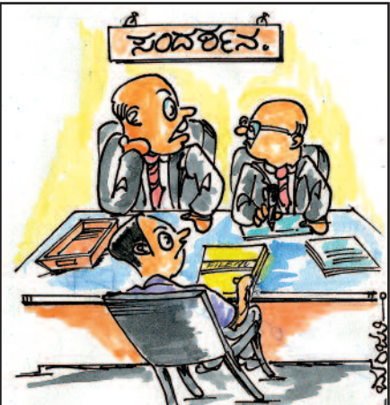
ಇವನೇನಿ... ನಮಗೇ ಇಂಟರ್ಯೂ ಮಾಡ್ತಾ ಇದಾನೆ! ಕಂಪನಿಯ ವಾರ್ಷಿಕ ಲಾಭ ಎಷ್ಟು? ಶೇರ್ ವ್ಯಾಲೂ ಎಷ್ಟು ಅಂತಿದ್ದಾನೆ!