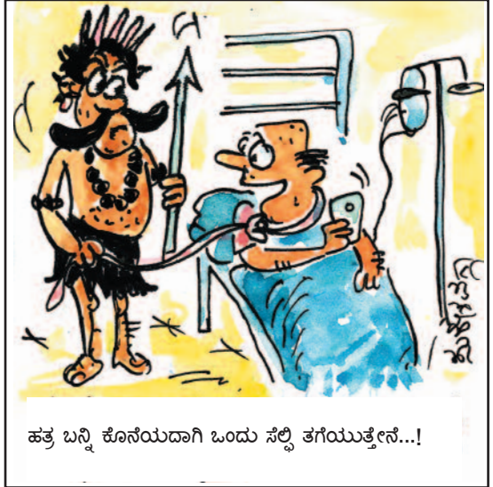
ಹತ್ತ ಬನ್ನಿ ಕೊನೆಯದಾಗಿ ಒಂದು ಸೆಲ್ಫಿ ತಗೆಯುತ್ತೇನೆ...!