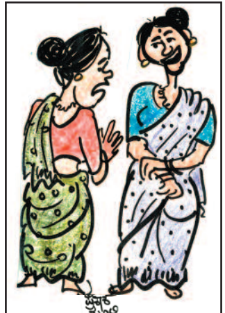
ಬೆಲೆ ಇಷ್ಟೊಂದು ದುಬಾರಿಯಾದೆ ಮುಂದೆ ತರಕಾರಿ ಕೊಳ್ಳುವಾಗಲೂ 'ಪಾನ್' ವಿವರ ಕೊಡಬೇಕೇನೋ!