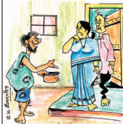
ನಿಮಗೆ ಬಿ.ಪಿ. ಶುಗರ್ ಇದೆ ಅಂತಾ... ನೀವು ಸಪ್ಪೆ ತಿನ್ನುವುದರ ಜೊತೆಗೆ ಅದನ್ನೆ ನನಗೂ ಹಾಕಿ ಅವಮಾನ ಮಾಡ್ತಾ ಇದ್ದೀರಲ್ಲಾ... ತಾಯಿ...!