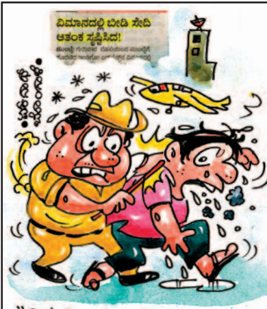
ನಿಮಾನದಲ್ಲಿ ಬೀದಿ ಸೇರಿ ಆತಂಕ ಸೃಷ್ಟಿಸಿದೆ! "ತಿಣ್ಣೆ ದಿಂಡು ಅಂಚ್ಚೆ ಕ್ಲೈಮ್ಸ್ ಸಾಹಿ.. ನಿಟ್ಟಿತ್ತಿ ಸೇದೊಣ್ಣೆ 'ಓಗಿರೇಣ್' ಇರೊಲ್ಲ...!"