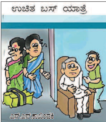
ಯಾವಾಗಲೂ ಅತ್ತೆ-ಸೊಸೆ ಜಗಳ ಮಾಡುತ್ತಿದ್ದರು. ಈಗ ಜೊತೆಯಾಗಿ ಪ್ರವಾಸಕ್ಕೆ ಹೊರಟು ನಿಂತಿದ್ದಾರೆ!