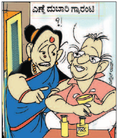
ಬೇಜಾರು ಮಾಡಿಕೊಳ್ಳಬೇಡಿ ಗ್ರಾಂಟಿ ಯೋಜನೆ ಮೂಲಕ ನಮಗೇ ಮರಳಿ ಬರುತ್ತೆ ಅಲ್ಲೇ?