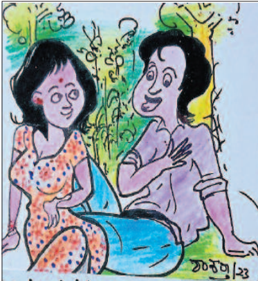
ನೀನು ನನ್ನ 'ಭಾಗ್ಯ ಜ್ಯೋತಿ'ಯಾಗು, 'ಗೃಹ ಜ್ಯೋತಿ'ಯಾಗು ಆದರೆ, 'ಸಾರಿಗೆ' ಸರಿ ಉಪ್ಪು ಹಾಕಿದ್ದೆ ಸಾಕು!