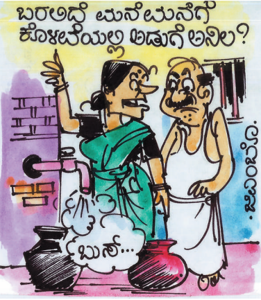
ನೀರಿನ ಬದಲು ಈ ದಿನ ಅಡುಗೆ ಅನಿಲ ಬಿಟ್ಟಿದ್ದಾರೋ.. ಅಂತ ನಿಮಗೂ ಅನುಮಾನ ಏನಿಲ್ಲ.. ಹಾಗೇನೂ ಆಗಿಲ್ಲ!