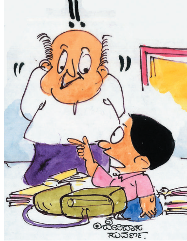
ಹೋಮ್ ವರ್ಕ್ ನೀವು ಹೇಳಿ ಕೊಟ್ಟಿದ್ದೆಲ್ಲ ತಪ್ಪಂತೆ ಪಪ್ಪಾ! ನಿಮಗೇ ಟ್ಯೂಶನ್‌ಗೆ ಹೋಗಿಕ್ಕೆ ಹೇಳಿದ್ದಾರೆ!