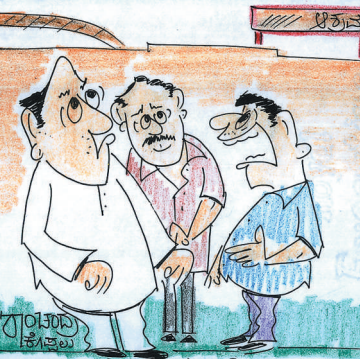
ಅಂದ ಹಾಗೇ.. ನೀವು ನಿತ್ಯಾನಂದರ ಕಡೆಯವು..? ಸದಾನಂದರ ಕಡೆಯವು?