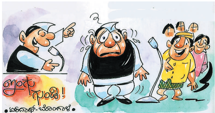
ಅಂತರ್ಜಲ ವೃದ್ಧಿಗಾಗಿ ನೀವೆಲ್ಲಾ 'ಇಂಗು ಗುಂಡಿ' ನಿರ್ಮಿಸುವ ಸಂಕಲ್ಪ ತೊಡಬೇಕು..! ಅವೆಲ್ಲಾ ಯಾಕ್ ಸರ್.. ಈ ಊರಿನ ರಸ್ತೆ ತುಂಬಾ ಟಾರ್ ಕಿತ್ತೋಗಿ ಈಗಾಗ್ಗೆ ಆಳವಾದ ಗುಂಡಿಗಳು ತಾವೇ ನಿರ್ಮಾಣ ಆಗಿವೆಯಲ್ಲಾ!