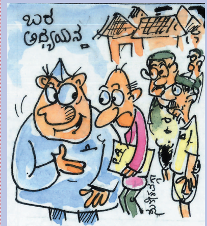
ನೆರೆ ಪೀಡಿತ ಹಳ್ಳಿಗಳನ್ನು ಬೇರೆಡೆ ಸ್ಥಳಾಂತರಿಸಿದ ಹಾಗೆ, ಈ ಬರ ಪೀಡಿತ ಹಳ್ಳಿಗಳನ್ನೂ ಬೇರೆಡೆ ಸ್ಥಳಾಂತರಿಸಬಹುದಲ್ಲ!