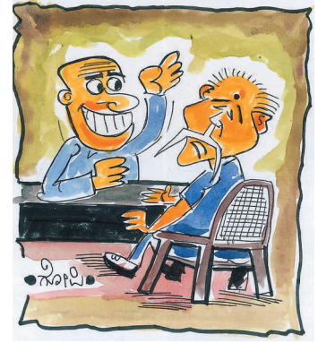
ಮೀಸೆ ತೆಗ್ಗು ಬಿಡಿ, ಅದ್ಯಷ್ಟ ಮುಲಾಯಿಸ್ಸದ ಸಾರ್..!