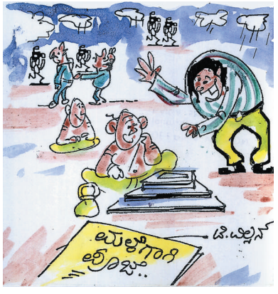
ಮಳೆ ಬರುವ ಲಕ್ಷಣಗಳಿವೆ..! ಮಾಧ್ಯಮ ಮಿತ್ರರು ಬರ್ರಾ ಇದ್ದಾರೆ. ಇನ್ನು ಪೂಜೆ ಪ್ರಾರಂಭಿಸಬಹುದು!