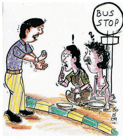
ಒಂದು ರೂಪಾಯಿ ಅಂತ ನಿರ್ಲಕ್ಷ್ಯ ಬೇಡ.. ಈಗ ಒಂದು ರೂಪಾಯಿಗೆ ಒಂದು ಕೇಜಿ ಅಕ್ಕಿ ಸಿಗುತ್ತೆ ಕಣಯ್ಯಾ..!