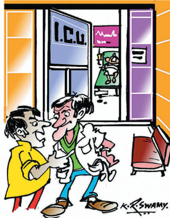
ಎಂಟು ದಿನಗಳಿಂದಲೂ ಹೊಚ್ಚಿಗೆ VENTILATOR ನಲ್ಲು ಇಡಬೇಡಿ ಸಾಕ್ಷರೇ...ಅಷ್ಟುನಬ್ಬಾಂಕ ಬ್ಯಾಲಿಸ್ ಅಪ್ಪೋ ಇರೋದು.....