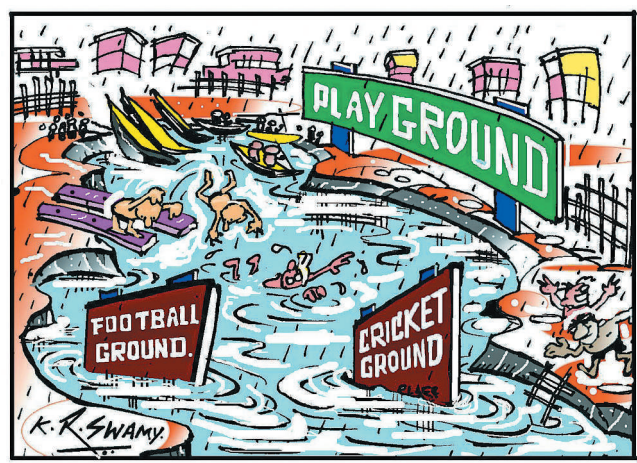
ಇವು ಕೆರೆ ಅಂಗಳ.... ಬೋಲಿಗಿಯಲ್ಲು 'ಬಣ ಅಟ' ಮಲ್ಲೆಗಾಲದಲ್ಲು 'ಬದ್ದೆ ಅಟ'..!