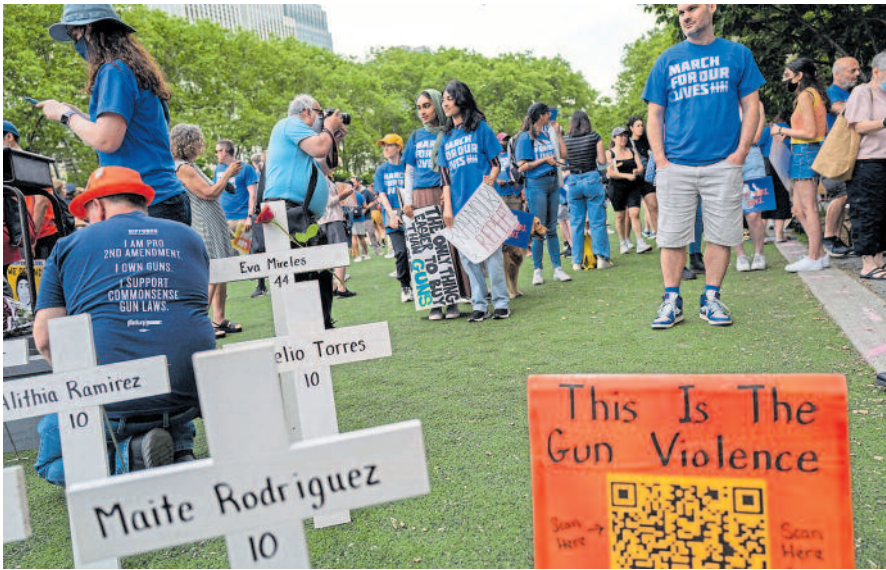
ಕರೆದರೆ ಓಗುಡುವ, ಕಚಗುಳಿಯುಟ್ಟರೆ ನಗುವ ಪುಟಾಣಿಗಳು ಬಿಳಿ ಹಲಗೆಯ ಮೇಲಿನ ಅಕ್ಷರಗಳಾಗುವ ದುರಂತಕ್ಕೆ ಹೋಕ ಯಾರು?