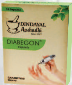
ಡಯಾಬಿಗೋನ್ ಕ್ಯಾಪ್ಸೂಲ್ ಡಯಾಬಿಟಿಸ್‌ಗೆ ಪರಿಣಾಮಕಾರಿಯಾಗಿದೆ