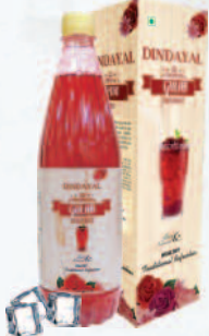
ದೀನಂದಯಾಳ್ ಟ್ರೀಮಿಯಂ ಗುಲಾಬ್ ಶರ್ಬತ್ ಆರೋಗ್ಯಕರ ಮತ್ತು ಸುಗಂಧಿತವಾಗಿದೆ