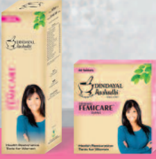
ದೀನಂದಯಾಳ್ ಫೆಮಿಕೇರ್ ಸಿರಸ್ ಮತ್ತು ಟ್ಯಾಬ್ಲೆಟ್ ಮಹಿಳೆಯರ ಉತ್ತಮ ಆರೋಗ್ಯಕ್ಕಾಗಿ