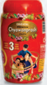
ದೀನಂದಯಾಳ್ ಚವನಪ್ರಾಶ್ ಚೇಸ್ತೀಯೂ ಮತ್ತು ಹೆಲ್ಪೀ ಕೂಡಾ ಹಸುವಿನ ತುಪ್ಪದಿಂದ ತಯಾರಿಸಲಾಗಿದೆ