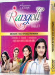
ರಂಗೋಲಿ ಟ್ಯಾಬ್ಲೆಟ್ ಮಹಿಳೆಯರಿಗೆ ಉತ್ತಮ ಶಕ್ತಿವರ್ಧಕವಾಗಿದೆ