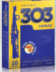
303 ಕ್ಯಾಪ್ಸೂಲ್ 40 ವರ್ಷಗಳಿಂದ ಪುರುಷರ ಶಕ್ತಿಶಾಲಿ ಸಂಗಾತಿ

240 ವರ್ಷಗಳಿಂದ ಆಯುರ್ವೇದ ಮೂಲಕ ಜನರಿಗೆ ಸೇವೆ ಒದಗಿಸಿರುವ ಪರಂಪರೆ ಹೊಂದಿದೆ. 600 ಕ್ಷಿಂತಲೂ ಹೆಚ್ಚು ಆಯುರ್ವೇದ ಉತ್ಪನ್ನಗಳನ್ನು ನಿರಂತರವಾಗಿ ಉತ್ಪಾದಿಸುತ್ತಾ ಬಂದಿದೆ. ಉತ್ಕೃಷ್ಟತೆ ಮತ್ತು ಸಂಶೋಧನೆ ಮೇಲೆ ವಿಶೇಷ ಗಮನ ಪರಿಸಲಾಗಿದೆ. ಜೀವನಶೈಲಿಗೆ ಅನುಗುಣವಾಗಿ ಸಮ್ಯಕ್ ಉತ್ಪನ್ನವಾದ ಆರೋಗ್ಯ ವರ್ಧಕ ಆಯುರ್ವೇದ ಉತ್ಪನ್ನಗಳು "ಸ್ಮಾರ್ಟ್ ಔಟ್ಲಿಟ್ಸ್"ಗಳಲ್ಲಿ ಲಭ್ಯವಿದೆ