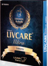
ದೀನಂದಯಾಳ್ ಲಿವ್‌ಕೇರ್ ಅಲ್ಟ್ರಾ ಟ್ಯಾಬ್ಲೆಟ್ ಲಿವರ್‌ನ ಸಂಪೂರ್ಣ ಸುರಕ್ಷೆಗಾಗಿ