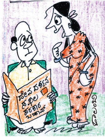
ಮುಖ್ಯಮಂತ್ರಿಗಳು ಯಾವ ದೇವರನ್ನು ಮೊರೆ ಹೋಗಿ ತಲಾಶ್ ಮಾಡಿಕೊಂಡಿದ್ದು..ರೀ