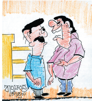
ಕೊನೆಗೂ ಸರ್ಕಾರ ಸುಭದ್ರ ಕಂಡ್ರೀ. ನಾವೀಗ ಅರ್ಹ ಮತದಾರರು..!