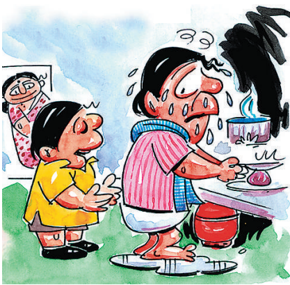
ಯಾಕೆ ಅಪ್ಪ ಅಡುಗೆ ಮಾಡುವಾಗಲೆಲ್ಲ ಅಳುತ್ತೀಯಾ? ಈರುಳ್ಳಿ ಹೆಚ್ಚಿ ದೈಕೋ ಅಥವಾ ಅಮ್ಮ ಅಡುಗೆ ಮಾಡಲು ಹೆಚ್ಚಿ ದೈಕೋ?