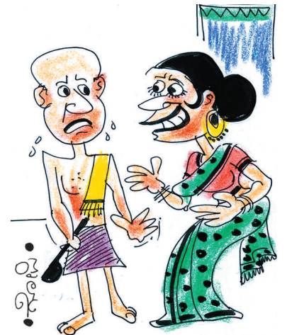
ನಮ್ಮ ಮಹಿಳಾ ವೇದಿಕೆಯಲ್ಲಿ ನಿಮ್ಮ ಕೈರುಚಿ ಬಗ್ಗೆ ಭಾರಿ ಹೊಗಳಿದ್ರು.. ರೀ..