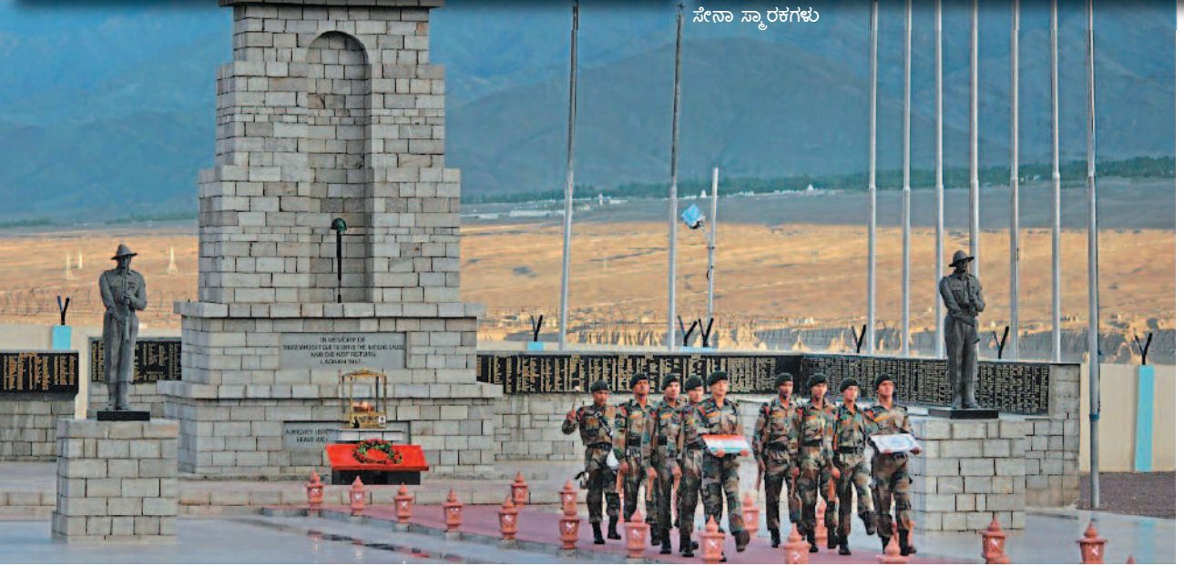
ಭಾರತೀಯ ಸೇನೆಯ 'ಹಾಲ್ ಆಫ್ ಫೇಮ್'