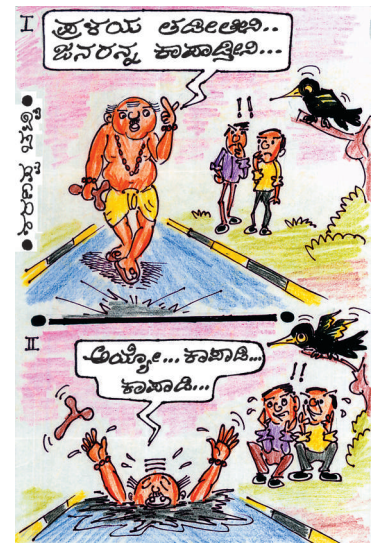
ಇನ್ನೂ ಒಂದೆ ನಂಗೆ ಮೂರು ಸೀರೆ ಕೊಡ್ತಾರಂತೆ ಹೌದಾ..?