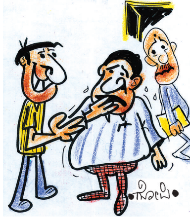
ಮದ್ದೆ ಯಾದ ನಂತ್ರ ಸ್ಲಿಮ್ ಆಗಿದ್ದೇನೆ. ನನ್ನಾ ಕೆ ವಾರಕ್ಕೆ ಎರಡು ದಿನನಾದ್ರೂ ಅಡುಗೆ ಮಾಡದೆ ಉಪವಾಸ ಆಗುತ್ತೆ!