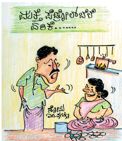
ಇದೇನೇ ನೀನು.. ಈ ಪೆಟ್ರೋಲ್ ಬೆಲೆಯಲ್ಲಿ ಗಾಡಿಯಲ್ಲಿ ಹೋಗಿ ಒಂದ್ಬಟ್ಟು ಕೊತ್ತಂಬರಿ ಸೊಪ್ಪು ತಂಗೊಂಡ್ತಾ ಅಂತೇಯಾ..?