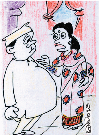
ಮುಂದಿನ ಚುನಾವಣೆಗೆ ನೀವು ನಿಲ್ಲೋದು ಬ್ಯಾಡಾರಿ, ರಾಜ್ಯದ ಖಜಾನೆಲಿ ದುಡ್ಡೇ ಇಲ್ವಂತೆ..!