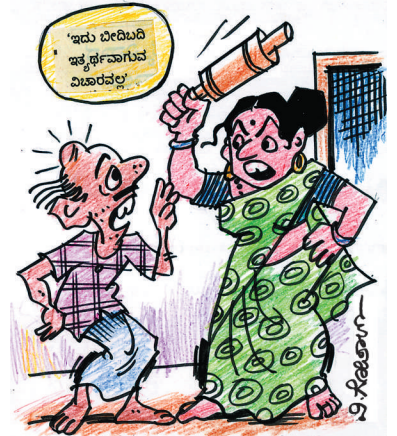
ಚೆನ್ನ ದ ಸರ ಕೊಡಿಸುವ ವಿಚಾರ ಮನೆಯಲ್ಲೇ ಇತ್ಯರ್ಥವಾಗಬೇಕು ಕಣ್ಣೇ.. ಗೊತ್ತಾಯಿತಾ?