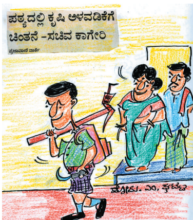
ಶಾಲೆಗೆ ಕಣ್ಣೇ..! ಇವತ್ತು ಕೃಷಿ ಪಾಠವಂತೆ, ಮಗಾ ಹುಷಾರು..!