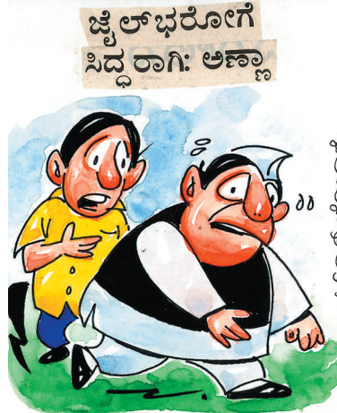
ಹಾಗೆ ಹೇಳಿದ್ರೂಂತ ನೀವೂ ತಯಾರಾಗೇ ಹೊರಟು ಬಿಟ್ಟಲ್ಲಾ ಸಾರ್? ನಿಮ್ಮಂತವರ ವಿರುದ್ಧವೇ ಅವು ಈ ಚಳವಳಿ ನಡೆಸುತ್ತಾ ಇರೋದು..!