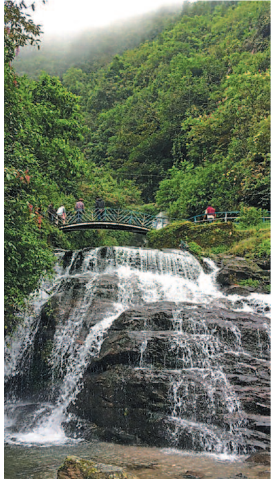
ರಾಕ್ ಗಾರ್ಡನ್ ಡಾರ್ಜಿಲಿಂಗ್