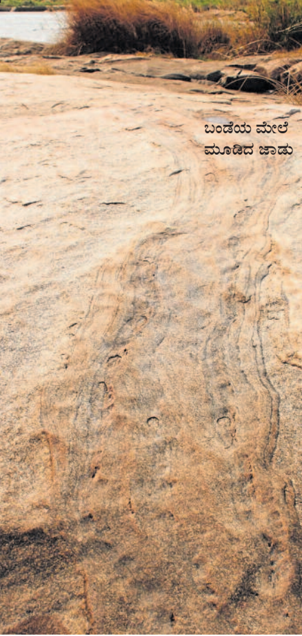
ಬಂಡೆಯ ಮೇಲೆ ಮೂಡಿದ ಚಾಡು