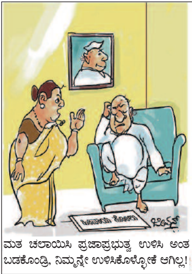
ಮತ ಚಲಾಯಿಸಿ ಪ್ರಜಾಪ್ರಭುತ್ವ ಉಳಿಸಿ ಅಂತ ಬಡಕೊಂಡಿ, ನಿಮ್ಮನ್ನೇ ಉಳಿಸಿಕೊಳ್ಳೋಕೆ ಆಗಿಲ್ಲ!