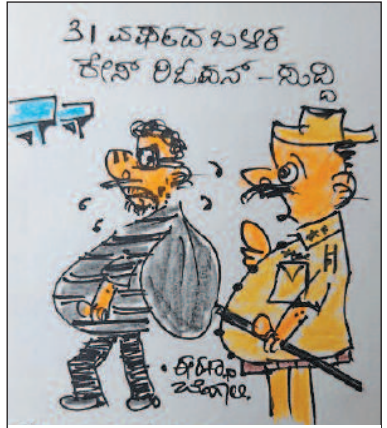
31 ವರ್ಷದ ನಂತರ ನೀನು ಇಲ್ಲಿ ಇಲ್ಲ ಇದ್ದರೂ ನರಕದಲ್ಲಿ ಚಿತ್ರಗುಪ್ತ ನಿನ್ನ ಕೇಸ್ ರೀ ಓಪನ್ ಮಾಡ್ತಾನೆ!