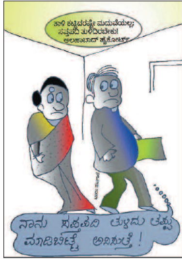
ನಾನು ಸಹಜವಾಗಿ ತ್ಯಾಜ್ಯ ತ್ಯಾಜ್ಯ ವ್ಯಾಜ್ಯವೆಷ್ಟೆ ಅರಿಸುತ್ತೇ!