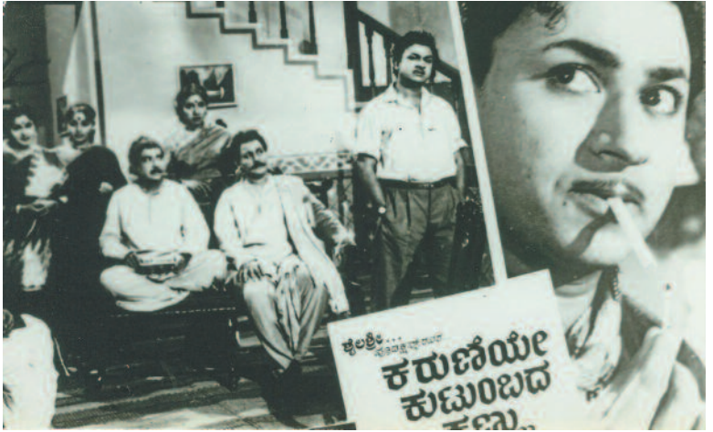
ಕಾದಂಬರಿ ಆಧಾರಿತ ಚಿತ್ರಗಳಿಗೆ ಮುನ್ನುಡಿ ಬರೆದ 'ಕರುಣೆಯೇ ಕುಟುಂಬದ ಕಣ್ಣು' ಸಿನಿಮಾ