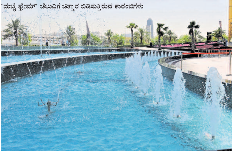
'ದುಬೈ ಫ್ರೇಮ್' ಚಿಲುವಿಗೆ ಚಿತ್ತಾರ ಬಿಡಿಸುತ್ತಿರುವ ಕಾರಂಜಿಗಳು

ದುಬೈ ಫ್ರೇಮ್‌ನ ಆಕರ್ಷಣೆಗಳು ಸುಲಭದ ಬಣ್ಣನೆಗೆ ನಿಲುಕುವಂತಹವಲ್ಲ. ಅವುಗಳನ್ನು ಅನುಭವಿಸಿಯೇ ತಿಳಿಯಬೇಕು. ದುಬೈ ಪ್ರವಾಸದ ಅವಕಾಶ ದೊರೆತಲ್ಲಿ, ಈ ಫ್ರೇಮ್‌ನ ಭಾಗವಾಗುವ ಸಾಧ್ಯತೆಯನ್ನು ತಪ್ಪಿಸಿಕೊಳ್ಳಬೇಡಿ.