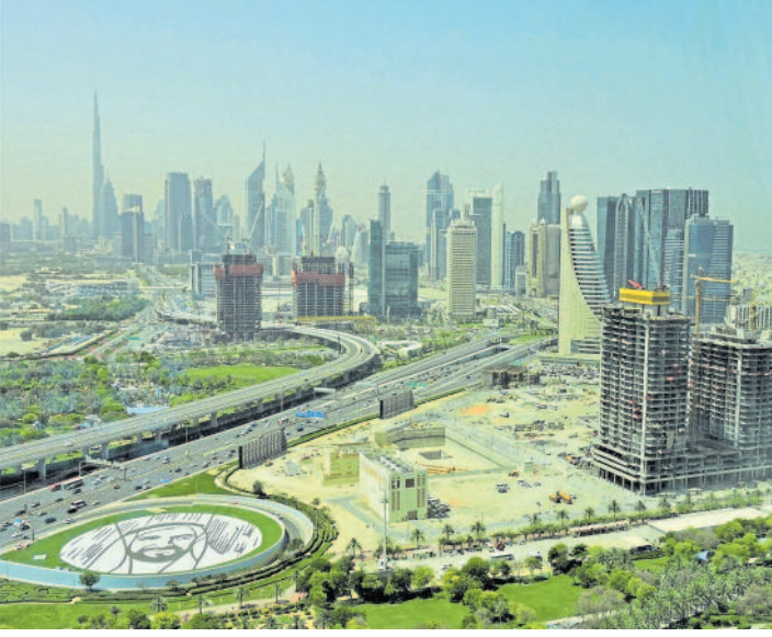
'ದುಬೈ ಫ್ರೇಮ್' ಮೂಲಕ ಕಾಣಿಸಿದ ದುಬೈ ಪಕ್ಷಿನೋಟ