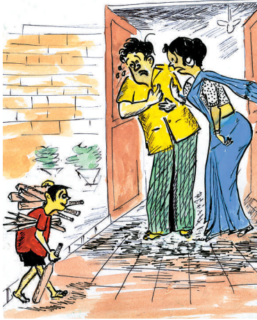
ಅಮ್ಮಾ ಇವಿಷ್ಟು ಫೈನಲ್ ಬೆಟ್ಟಿಂಗ್‌ನಲ್ಲಿ ಗೆದ್ದಿದ್ದು!