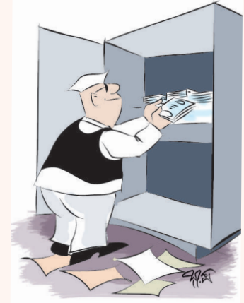
ಮೌಲ್ಯ ಇವರ ತಿಜೋರಿಗೆ, ಸಿದ್ಧಾಂತ ಹೊರಕ್ಕೆ!