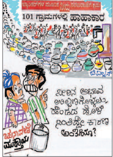
ಖಾಲಿ ಆಲುವ ಉಲ್ಲಣಿಸೊಳ್ಳಲಾ, ಹೊಂಡದ ಸೊಳ್ಳೆ ನಿಂತಿದ್ದೀ ಕಾರಣ ಅಂತಿರಿಸ್ತಾ?