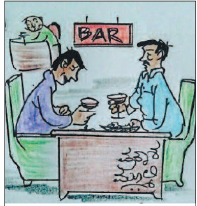
ಇಲ್ಲಿಗೆ ಬರುವುದು ಮರೆತೇ ಬಿಟ್ಟಿದ್ದೆ. ರೇಡಿಯೊದಲ್ಲಿ 'ಬಾರ್ ಬಾರ್ ದೇಖೋ...' ಹಾಡು ಕೇಳುವಾಗ ನೆನಪಾಗಿ ಬಂದೆ!