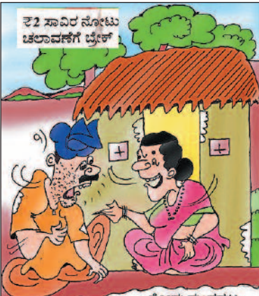
2000 ರೂಪಾಯಿ ಇನ್ನು ಮುಂದೆ ಇಲ್ಲ ಇಲ್ಲ ಅಂತ ಹೆಂಗಿತ್ತು ಅಂತ ನೀನೇನಾದ್ರೂ ನೋಡಿದ್ದಾ?