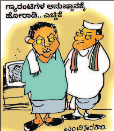
ಇಷ್ಟೆಲ್ಲ ಬಹುಮತ ಬರುತ್ತೆ ಅಂತ ಯಾರಿಗೆ ಗ್ಯಾರಂಟಿ ಇತ್ತೀ. ವೋಟು ಬರಲಿ ಅಂತ ಘೋಷಿಸಿದವು. ಅದೇ ಕಷ್ಟ ಆಗಿದೆಯಲ್ಲೀ.