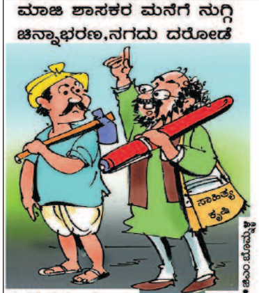
ರೈತ, ಸಾಹಿತಿ ಮನೆಯಲ್ಲಿ ದರೋಡೆ ಮಾಡಿರುವ ಸುದ್ದಿ ಯಾವತ್ತಾದ್ರೂ ಬಂದಿತ್ತಾ? ಕಳ್ಳರಿಗೂ ಗೊತ್ತು, ನಮ್ಮ ಮನೆಯಲ್ಲಿ ಏನೂ ಸಿಗಲ್ಲ ಅಂತ!