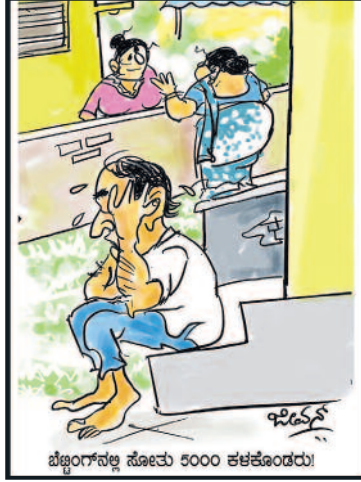
ಬೆಂಗಳೂರಿನಲ್ಲಿ ಸೋಮ 9000 ಕೆಳಕೊಂಡರು!