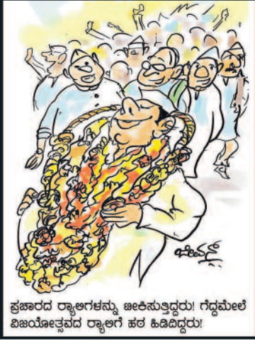
ಪ್ರಚಾರದ ರ್ಯಾಲಿಗಳನ್ನು ಊಹಿಸುತ್ತಿದ್ದರು! ಗೆದ್ದಮೇಲೆ ವಿಜಯೋತ್ಸವದ ರ್ಯಾಲಿಗಳ ಹಲ ಹಿಡಿದಿದ್ದರು!