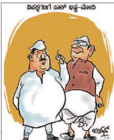
ನನಗೆ ಮೈಸೂರುಪಾಕ್ ಇಷ್ಟ ಅಂತ ಹೇಳಿದ್ದೆ! -ಚಿಕ್ಕಣ್ಣ