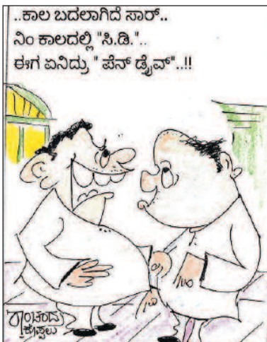
..ಕಾಲ ಬದಲಾಗಿದೆ ಸಾರ್.. ನಿಂ ಕಾಲದಲ್ಲಿ "ಸಿ.ಡಿ.." ಈಗ ಏನಿದ್ದು "ಪೆನ್ ಡೈವ್"!!! -ಗ್ರಂಥಾಸ್ ಕ್ರಾಪ್ಪಾಲು