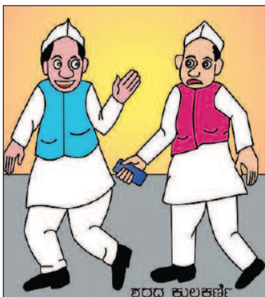
ಸುಳ್ಳು ಹೇಳುವುದನ್ನು ನಮ್ಮ ಪಾರ್ಟಿಯೇ ಪೇಟೆಂಟ್ ಮಾಡಿಸಿ ಇಟ್ಟುಕೊಳ್ಳಬೇಕಿತ್ತು. ಈಗ ನೋಡಿ ಎಲ್ಲ ಪಾರ್ಟಿಗಳು ಸುಳ್ಳು ಹೇಳುತ್ತಿವೆ! -ಶರಣ ಕುಲಕರ್ಣಿ