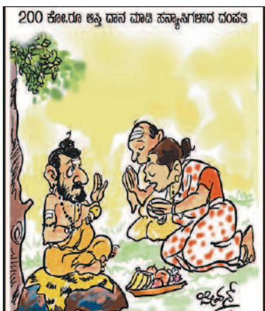
ಮಕ್ಕಳಿಂದಲೇ ಪ್ರೇರಣೆ ಪಡೆದ ಮೊದಲ ಸರ್ವತ್ಯಾಗಿ ತಂದೆ-ತಾಯಿ ಎಂಬುದೇ ನಮ್ಮ ಹೆಮ್ಮೆ ಸ್ವಾಮಿ! -ಚಿಕ್ಕಣ್ಣ