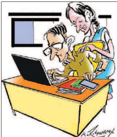
ಆಕಾಶದಲ್ಲಿ ನಿಮ್ಮ 10 ಸೈಟ್ ಇವೆ. ಭೂಮಿ ಮೇಲೆ ಒಂದೂ ಇಲ್ಲಲ್ಲೇ! -ಕೆ.ಎಸ್.ವಿಷ್ಣು