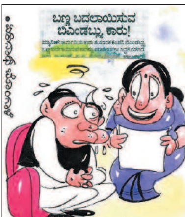
ನೀವೂ ಇದೇ ರೀತಿ ಅಲ್ಲವಾ? ಈ ಚುನಾವಣೆಯಲ್ಲಿ ಸೋತಿದ್ದೀರಿ ಸರಿ. ಗೆದ್ದಿದ್ದರೆ ಆಪರೇಷನ್ ಪಕ್ಕ! -ಶಿಲಂಕರ್ ಶ್ರೀಲಕ್ಷ್ಮಣ್