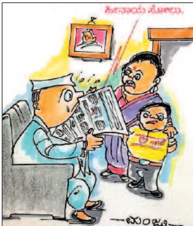
ಹೋಗಲಿ ಬಿಡಿ... ಈ ಹಿಂದೆ ರಾಜಕೀಯದಿಂದ ಗಳಿಸಿದ್ದೇ ಹತ್ತು ತಲೆಮಾರಿಗೆ ಆಗುವಷ್ಟು ಇಲ್ಲವೇ? -ಮಂಜು