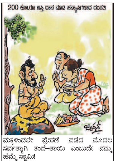
ಮಕ್ಕಳಿಂದಲೇ ಪ್ರೇರಣೆ ಪಡೆದ ಮೊದಲ ಸರ್ವತೃಗಿ ತಂದೆ-ತಾಯಿ ಎಂಬುದೇ ನಮ್ಮ ಹೆಮ್ಮೆ ಸ್ವಾಮಿ! 200 ಕೋಟಿ ರೂಪಾಯಿ ದಾನ ಮಾಡಿ ಹ್ಯಾನ್ಡ್‌ಟ್ಯಾನ್ ಮಾಡಿದ ದಂಪತಿ