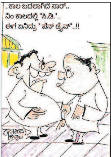
..ಕಾಲ ಬದಲಾಗಿದೆ ಸಾರ್.. ನಿಂ ಕಾಲದಲ್ಲಿ "ಸಿ.ಡಿ.." ಈಗ ಏನಿದ್ದು "ಪೆನ್ ಡೈವ್"...!!