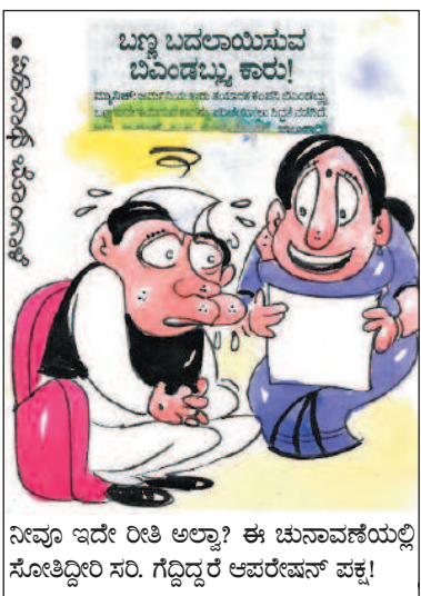
ನೀವೂ ಇದೇ ರೀತಿ ಅಲ್ಲವಾ? ಈ ಚುನಾವಣೆಯಲ್ಲಿ ಸೋತಿದ್ದೀರಿ ಸರಿ. ಗೆದ್ದಿದ್ದರೆ ಆಪರೇಷನ್ ಪಕ್ಕ! ಬಣ್ಣ ಬದಲಾಯಿಸುವ ಬಿವಿಂಡಬ್ಬು ಕಾರು!