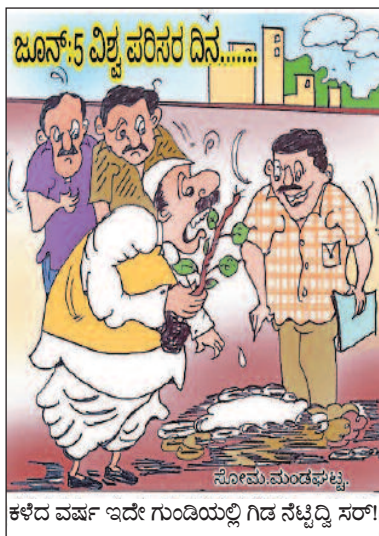
ಕಳೆದ ವರ್ಷ ಇದೇ ಗುಂಡಿಯಲ್ಲಿ ಗಿಡ ನೆಟ್ಟಿದ್ದಿ ಸರ್! ಸೋಮಮಂಡಪಟ್ಟಿ