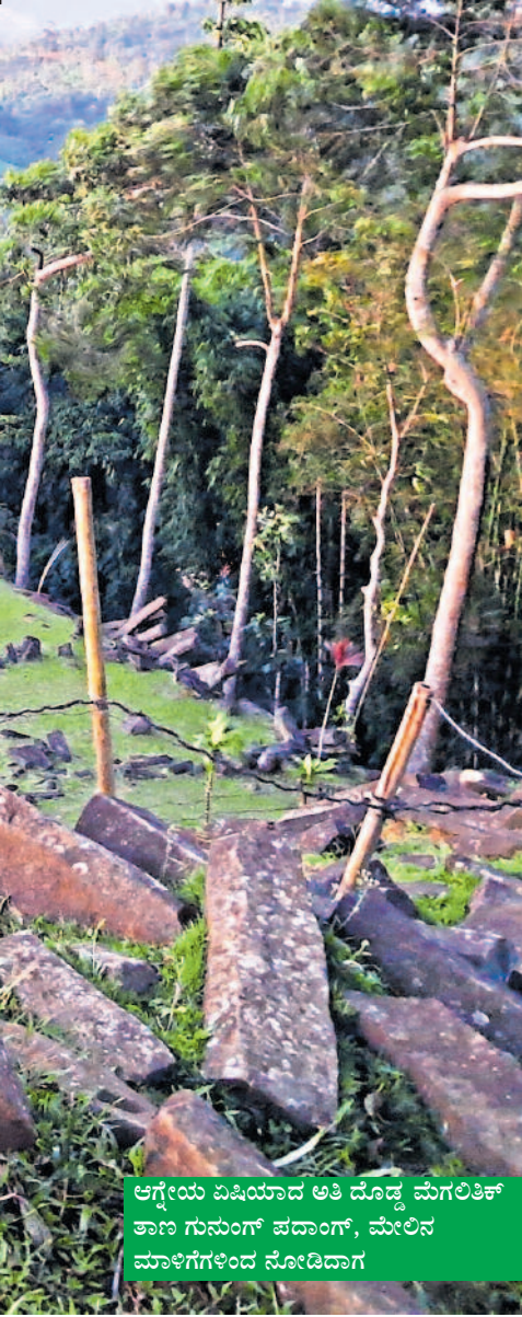
ಆಗ್ನೇಯ ಏಷಿಯಾದ ಅತಿ ದೊಡ್ಡ ಮೆಗಾಲಿಥಿಕ್ ತಾಣ ಗುನುಂಗ್ ಪದಾಂಗ್, ಮೇಲಿನ ಮಾಳಿಗೆಗಳಿಂದ ನೋಡಿದಾಗ