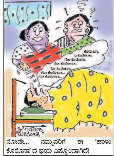
ನೋಡೇ... ನಮ್ಮವರಿಗೆ ಈ 'ಹಾಳು ಕೊರೋನಾ'ದ ಭಯ ಎಷ್ಟೊಂದಾಗಿದೆ!