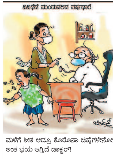
ಮಳೆಗೆ ಶೀತ ಆದ್ರೂ ಕೊರೋನಾ ಚಿಹ್ನೆಗಳೇನೋ ಅಂತ ಭಯ ಆಗಿದೆ ಡಾಕ್ಟರ್!