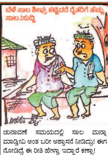
ಚುನಾವಣೆ ಸಮಯದಲ್ಲಿ ಸಾಲ ಮನ್ನಾ ಮಾಡ್ತೀವಿ ಅಂತ ಬರೀ ಅಶ್ವಾಸನೆ ನೀಡಿದ್ದು! ಈಗ ನೋಡಿದ್ರೆ ಈ ರೀತಿ ಹೇಳ್ತಾ ಇದ್ದಾರೆ ಕಣ್ಣಾ!