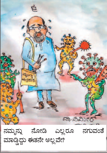
ನಮ್ಮನ್ನು ನೋಡಿ ಎಲ್ಲರೂ ನಗುವಂತೆ ಮಾಡಿದ್ದು ಈತನೇ ಅಲ್ಲವೇ?