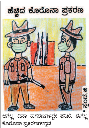
ಆಗಲ್ಲ ದಿನಾ ಹಗರಣಗಳದ್ದೇ ತನಿಖೆ, ಈಗಲ್ಲ ಕೊರೋನಾ ಪ್ರಕರಣಗಳದ್ದು!