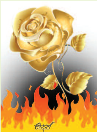
ಚೆನ್ನದ ಹೂವು ಎಂದನಾ ಅಕ್ಕಸಾಲಿಗ.