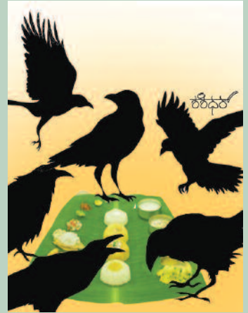
ಬೇರೆ ಪಕ್ಷಿಗಳು ಹಂಚಿ ತಿನ್ನದೆ ಪಿಂಡ ಮಿಕ್ಕುಬಿಟ್ಟರೆ ಆತ್ಮ ಅರೆದಾರಿ ಮಾತ್ರ ಸಾಗಿ ಅಂತರ್ಜೀವಿ ಆಗುವುದಂತೆ.