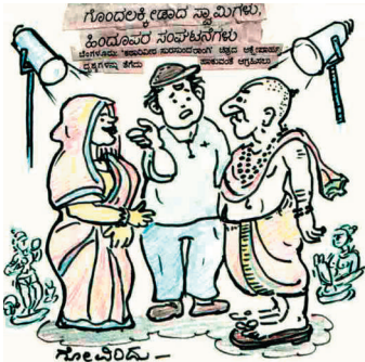
ಹೀರೋಯಿನ್ ಉಡುಪು ಇಷ್ಟಿದ್ದರ ಸಾಕೆ? ಆಮೇಲೆ ಆಕೆ ವೇಷ ಮಾಡಬೇಡಿ!