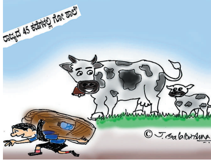
ನಾನೂ ಆ ರೀತಿ ಶಾಲೆಗೆ ಹೋಗಬೇಕಾಗುತ್ತೇನಮ್ಮಾ?

ಹೀಗೊಂದು ವಿಶ್ಲೇಷಣೆ ಟೀ.ವಿ.ಯಲ್ಲಿ ಸದಾ 'ಎಕ್ಸ್‌ಪರ್ಟ್ ಕಮೆಂಟ್ರಿ' ನೀಡುವ ವಿಶ್ಲೇಷಣಾಕಾರರೊಬ್ಬರು ವಿಮಾನದಲ್ಲಿ ಬೆಂಗಳೂರಿನಿಂದ ಸಿಂಗಾಪುರಕ್ಕೆ ಪ್ರಯಾಣಿಸುತ್ತಿದ್ದರು. ವಿಮಾನ 'ಟೀಕಾಫ್' ಆದ ಸ್ವಲ್ಪ ಹೊತ್ತಿನಲ್ಲೇ ಪೈಲಟ್ ಅನೌನ್ಸ್ ಮಾಡಿದ- 'ಏರೋಪ್ಲೇನ್‌ನ ಒಂದು ಇಂಜಿನ್ ಈಗ ತಾನೆ ಕೆಟ್ಟಿದೆ. ಹಾಗೆಂದು ಪ್ರಯಾಣಿಕರು ಗಾಬರಿ ಪಡುವ ಅಗತ್ಯವಿಲ್ಲ. ಇನ್ನೂ 3 ಇಂಜಿನ್‌ಗಳು ಕೆಲಸ ಮಾಡುತ್ತಿವೆ. ಆದರೆ ಒಂದು ಗಂಟೆಯ ಬದಲಾಗಿ ಈಗ ನಮ್ಮ ಪ್ರಯಾಣದ ಅವಧಿ 7 ಗಂಟೆಯಾಗುತ್ತದೆ, ಅಷ್ಟೆ.' ಸ್ವಲ್ಪ ಹೊತ್ತಿನ ನಂತರ ಮತ್ತೊಮ್ಮೆ ಪೈಲಟ್