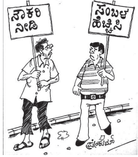
ನನ್ನ ಬೇಡಿಕೆ ಈಡೇರಿದ ಮೇಲೆ... ನಿಮ್ಮ ಜೊತೆಗೆ ಸೇರುತ್ತೇನೆ..!