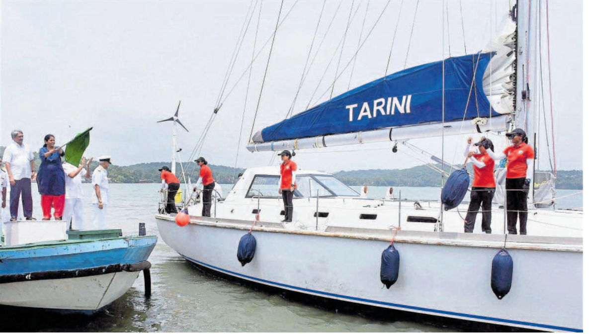
ಡಿಲ್ಲ ಕೆ. ಮತ್ತು ರೂಪ ಅಳಗಿರಿ ಸ್ವಾಮಿ ಇಬ್ಬರೂ ಸಾಗರಯಾನ ಮಾಡಲು ಹೊರಟ ಐಎನ್‌ಎಸ್‌ವಿ 'ತಾರಿಣಿ'ಗೆ ರಕ್ಷಣಾ ಸಚಿವ ನಿರ್ಮಲಾ ಸೀತಾರಾಮನ್ ಚಾಲನೆ ನೀಡಿದ ಸಂದರ್ಭ

(2010) ಮತ್ತು 'ಸಾಗರ ಪರಿಕ್ರಮ-2' (2013) ಯಾತ್ರೆಗಳಲ್ಲಿ ವಿಶ್ವ ಪರ್ಯಟನೆಯನ್ನು ಯಶಸ್ವಿಯಾಗಿ ಮಾಡಿ ಮುಗಿಸಿದ್ದರು. ಮೂರನೆಯ ಸಾಗರ ಪರಿಕ್ರಮ 2017ರಲ್ಲಿ ನಡೆದಿತ್ತು. ಅದರಲ್ಲಿ ಲೆಫ್ಟಿನೆಂಟ್ ಕಮಾಂಡರ್ ಆಗಿದ್ದ ಮಹಿಳಾ ಅಧಿಕಾರಿ ವರ್ತಿಕಾ ಜೋಶಿ ಅವರು ಐದು ಜನರ ತಂಡವನ್ನು ಕಟ್ಟಿಕೊಂಡು ವಿಶ್ವಪರ್ಯಟನೆ ಮಾಡಿದ ಕೀರ್ತಿಗೆ ಪಾತ್ರರಾಗಿದ್ದರು.