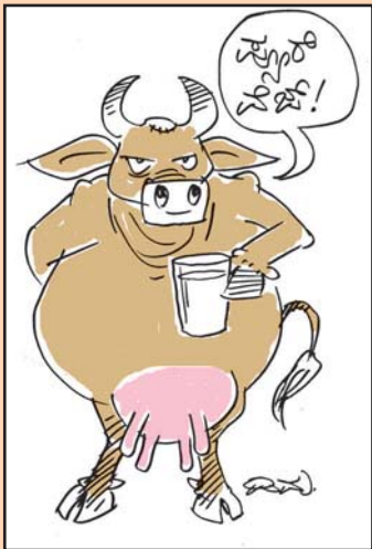
ಕರು ಸಸ್ತಾಹಾರಿಯಾದ್ದರಿಂದ ಹಾಲು ಮಾಂಸಾಹಾರವಲ್ಲ.