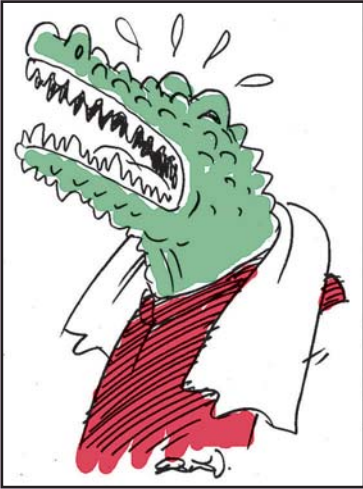
ಮೊಸಳೆಗೆ ಸಹಜ, ಮಾನವನಿಗೆ ಅಸಹಜ!