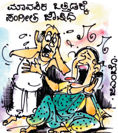
ಅದೆಂತಹ ಒತ್ತಡವನ್ನಾದ್ರೂ ತಡ್ಕೊಡತೀನಿ ಕಣ್ಣೇ! ಈ ನಿನ್ನ ಕುಗಾಟ ಮಾತ್ರ ನನ್ನಿಂದ ಸಹಿಸಿಕೊಳ್ಳಲು ಸಾಧ್ಯವೇ ಇಲ್ಲ!