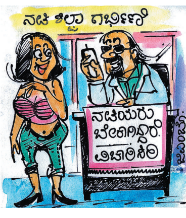
ಐಶ್ವರ್ಯಾ, ಶಿಲ್ಪಾ.. ಮೊದಲಾದ ನಟಿಯರಲ್ಲಿ ಸದ್ಯಕ್ಕೆ ವಿಶ್ರಾಂತಿಯಲ್ಲಿದ್ದಾರೆ, ಈಗೇನಾದ್ರೂ ಒಂದು ಚಾನ್ಸ್ ಸಿಗಬಹುದು.. ಮೇಡಂ!