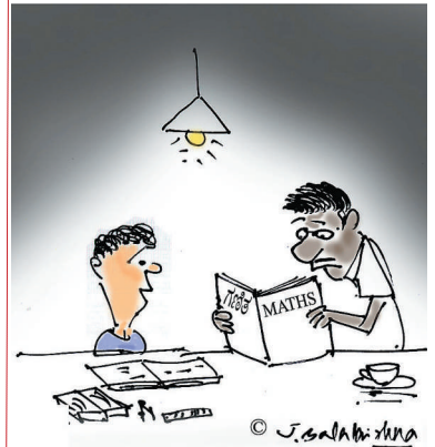
ನಿಂಗೂ ಟ್ಯೂಷನ್‌ಗೆ ಹೋಗಬೇಕು ಅನ್ನಿಸುತ್ತಾ ಅಪ್ಪಾ?