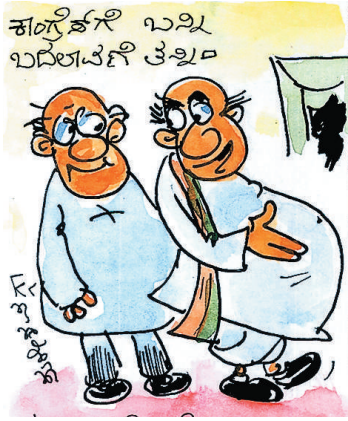
ನಡೀರಿ ಹೋಗೋಣ... ಬಿಜೆಪಿಯಲ್ಲಿ ಸಾಕಷ್ಟು ಬದಲಾವಣೆ ಮಾಡಿದ್ದಾಯ್ತು...