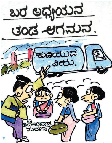
ಅದು ನಿಮಗಲ್ಲ. ಬರ ಅಧ್ಯಯನ ತಂಡದವರಿಗೆ!