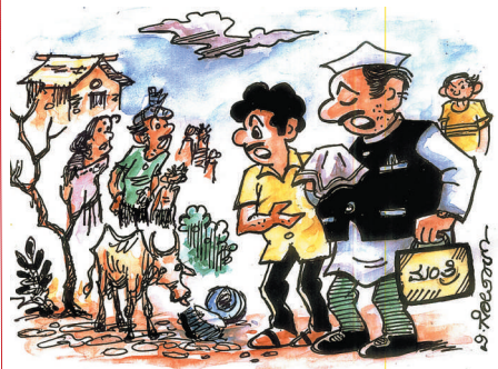
ನಿಮ್ಮ ಬರ ಪರಿಷ್ಕಿತಿ ನೋಡಿ ಮಂತ್ರಿಗಳು ಕಣ್ಣೇರು ಸುರಿಸುತ್ತಿದ್ದರು, ಆದರೆ ಅವರ ಕಣ್ಣೇರಿಗೂ, ಬರ ಬಂದಿದೆಯಂತೆ ಕಣ್ಣೇ..!