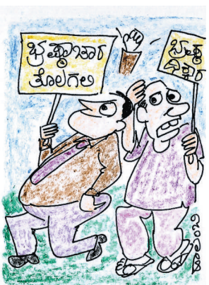
ಎಲಾ ಇವನ! ನಾನೇ ಇವನಿಗೆ ಮೊನ್ನೆ ಲಂಚ ಕೊಟ್ಟಿದ್ದೇನಲ್ಲಾ!