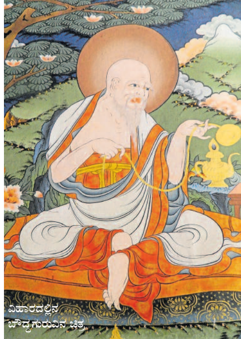
ವಿಹಾರದಲ್ಲಿನ ಬೌದ್ಧಗುರುವಿನ ಚಿತ್ರ