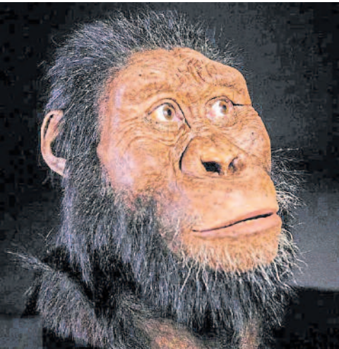
ನಮ್ಮೆಲ್ಲರ ಮೂಲಪುರುಷ ಆಸ್ಟ್ರಲೋಪಿಥೆಕಸ್

ನೀವು ಪಟಪಟ ಗುಂಪುಗಳಾಗಿ ವಿಂಗಡಿಸಿ ಯೂರೋಪಿಯನ್, ಆಫ್ರಿಕನ್, ಅಮೆರಿಕನ್, ಏಷ್ಯನ್, ಮಂಗೋಲಿಯನ್ - ಹೀಗೆ ಹೇಳುತ್ತಾ ಹೋಗಬಹುದು. ವಾಸ್ತವವಾಗಿ ಇದು ಪ್ರಭೇದದ ಲೆಕ್ಕಕ್ಕೆ ಬರುವುದಿಲ್ಲ. ಏನಿದ್ದರೂ 'ರೇಸ್' ಎಂಬ ಪದದಡಿ ಇವರನ್ನೆಲ್ಲ ಸೇರಿಸಿಬಿಡುತ್ತೇವೆ. ರೇಸ್ ಎಂದರೆ ಜನಾಂಗ, ಪ್ರಭೇದವಲ್ಲ. ಹಿಟ್ಟರ್ ಹೊಡೆದಾಡಿದ್ದು ಇದೇ ಜನಾಂಗೀಯ ಶ್ರೇಷ್ಠತೆಗಾಗಿ. ಏನಿದ್ದರೂ ಭೌಗೋಳಿಕವಾಗಿ ಭಿನ್ನ ಭಿನ್ನ ಪರಿಸರದಲ್ಲಿ ಅಲ್ಪಸ್ವಲ್ಪ ಬದಲಾವಣೆ ಮಾಡಿಕೊಂಡ ಮನುಕುಲವೆಲ್ಲ ಒಂದೇ ಪ್ರಭೇದಕ್ಕೆ ಸೇರಿದ್ದು. ಅಂದರೆ 'ಹೋಮೋಸೇಪಿಯನ್'. ಇನ್ನೂ ಸ್ವಲ್ಪ ವಿಶಾಲಾರ್ಥದಲ್ಲಿ ಯೋಚಿಸಬೇಕೆಂದರೆ, ಅಡಿಗರ ಪದ್ಧದ ಸಾಲನ್ನು ನೆನಪಿಸಿಕೊಳ್ಳಿ: 'ನಾವೆಲ್ಲರು ಒಂದೇ ಜಾತಿ, ಒಂದೇ ಮತ, ಒಂದೇ ಕುಲ; ನಾವು ಮನುಜರು'. ಪಂಪನದೂ ಅದೇ ಉದ್ದೋಷ: 'ಮನುಷ್ಯ ಜಾತಿ ತಾನೊಂದೇ ವಲಂ.'