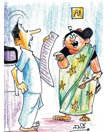
ಐಪಿಎಲ್ ಕರೆಂಟ್ ಬಿಲ್... ನಿಮ್ಮ ದೋನಿ ಬಂದು ಕಟ್ಟಾನಾ..?