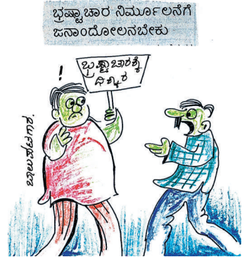
ಜನರು ಭ್ರಷ್ಟ ವ್ಯವಸ್ಥೆಗೆ ಎಷ್ಟು ಹೊಂದಿಕೊಂಡಿದ್ದಾರೆ ಅಂದ್ರೆ, ಈ ಆಂದೋಲನದಲ್ಲಿ ಭಾಗವಹಿಸಿದರೆ ಎಷ್ಟು ಕೊಡ್ತೀರಾ ಅಂತಾ ಕೇಳಾರೆ, ಸಾರ್!