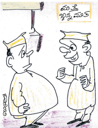
'ಅತ್ತುತ್ತಮ ಭಿನ್ನ ಮತೀಯ' ಅಂತ ಒಂದು ಪಾರಿತೋಷಕ ಕೊಡುವ ವ್ಯವಸ್ಥೆ ಮಾಡೋಣ್ವಾ ಸಾರ್?