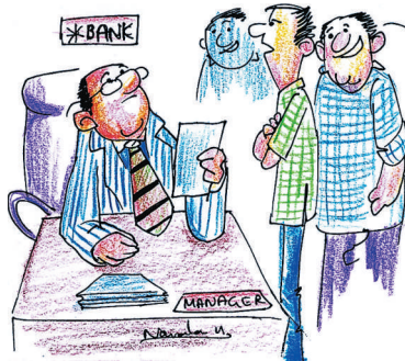
ಆಫೀಸ್‌ಗೊಂದು ಟಿಪಿ ಬೇಕು ಸಾರ್...! ಐಪಿಎಲ್ ಮುಗಿಯುವವರೆಗೆ ಕೊಟ್ಟರೆ ಸಾಕು