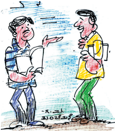
ಪರೀಕ್ಷೆ ಭಯ ಬೇಡ ಎಂಬ ಪುಸ್ತಕ ನೋಡಿದೆ ಒಳಗೆ ಕಾಪಿ ಹೊಡೆಯುವ ತಂತ್ರಗಳ ವಿವರ ಇದೆ!