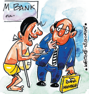
ಇವತ್ತು ಎಷ್ಟು ಮಾರಾಟ ಆಯ್ತು ಸಾರ್? ಯಾರಾದ್ರೂ 'ಚಿನ್ನದ ನಾಣ್ಯ' ಹಾಕಬಹುದು ಅಂತ ಕಾಯ್ದಾ ಇಡ್ತೀನಿ!