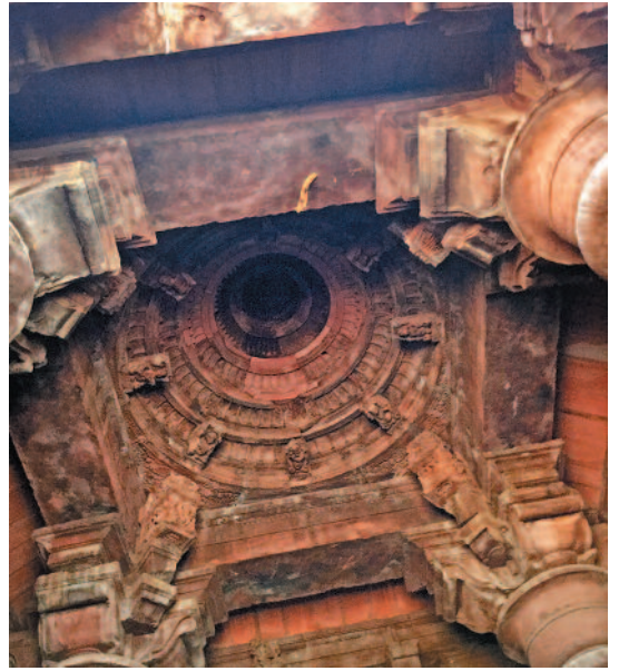
ಕೆತ್ತನೆಯ ಅದ್ಭುತ ನಮೂನೆ

ಹಲವಾರು ಶಿವಲಿಂಗಗಳನ್ನು ಜನರು ಅಪಹರಿಸಿದ್ದು, ಎರಡು ಶಿವಲಿಂಗ- ಗಳು ಮಾತ್ರ ಉಳಿದಿವೆ ಎನ್ನುತ್ತಾರೆ ಶಿವಾಲಯದ ಅರ್ಚಕರು.