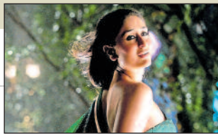
ಕರೀನಾ ಕರ್ಮಬ್ಯಾಕ್ —ಬಿಂದು