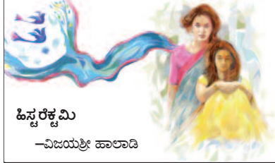
ಹಿಟ್ಟ ರಕ್ಷಮಿ —ವಿಜಯಶ್ರೀ ಹಾಲಾದಿ