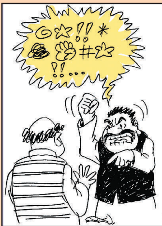
ವಿರೋಧಪಕ್ಷದವರು ಆಡಳಿತ ಪಕ್ಷದವರನ್ನು ಸಂಬೋಧಿಸಲು ಉಪಯೋಗಿಸುವ ಭಾಷೆ.