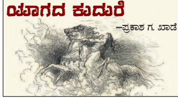
ಯಾಸಗದ ಕುದುರೆ —ಪ್ರಕಾಶ ಗ. ಖಾಡೆ