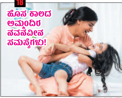
18 ಹೊಸ ಕಾಲದ ಅಮ್ಮಂದಿರ ನವನವೀನ ಸಮಸ್ಯೆಗಳು!

ಅಮ್ಮ ಎನ್ನುವ 'ವ್ಯಕ್ತಿಚಿತ್ರ' ಯಾವ ಕಾಲಕ್ಕೂ ಬದಲಾಗದಿರಬಹುದು. ಆದರೆ, ಅಮ್ಮನ ಎದುರಿಗಿರುವ ಸವಾಲುಗಳು ಬದಲಾಗುತ್ತಲೇ ಇರುತ್ತವೆ. ಈ ಕಾಲದ ಅಮ್ಮಂದಿರನ್ನೇ ನೋಡಿ, ಮಕ್ಕಳನ್ನು ಬೆಳೆಸುವುದಕ್ಕೆ ಸಂಬಂಧಿಸಿದಂತೆ ಅವರು ತಮ್ಮ ತಾಯಿ-ಅಜ್ಜಿಗಿಂತಲೂ ಭಿನ್ನವಾದ ಸವಾಲುಗಳನ್ನು ಎದುರಿಸುತ್ತಿದ್ದಾರೆ. ಮಕ್ಕಳಿಗೆ ಏನನ್ನು ತಿನ್ನಿಸಬೇಕು ಎನ್ನುವುದರಿಂದ ಹಿಡಿದು, ಏನನ್ನು ನೋಡಿಸಬೇಕು ಹಾಗೂ ಏನನ್ನು ಮರೆಮಾಚಬೇಕು ಎನ್ನುವವರೆಗೆ ಹಲವು ಸವಾಲುಗಳನ್ನು 'ಹೊಸ ಕಾಲದ ಅಮ್ಮಂದಿರು' ಎದುರಿಸುತ್ತಿದ್ದಾರೆ.