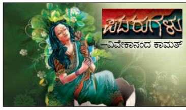
ಸದರುಗಳು —ವಿವೇಕಾನಂದ ಕಾಮತ್