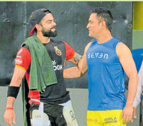
ಇಂಗ್ಲೆಂಡ್‌ನಲ್ಲಿ ನಡೆಯುವ ವಿಶ್ವಕಪ್ ಕ್ರಿಕೆಟ್‌ನಲ್ಲಿ ವಿರಾಟ್ ಕೊಹ್ಲಿ ಪಾಲಿಗೆ ಧೋನಿ ಅವರದ್ದು ಚಾಣಾಕ್ಷನ ಪಾತ್ರ