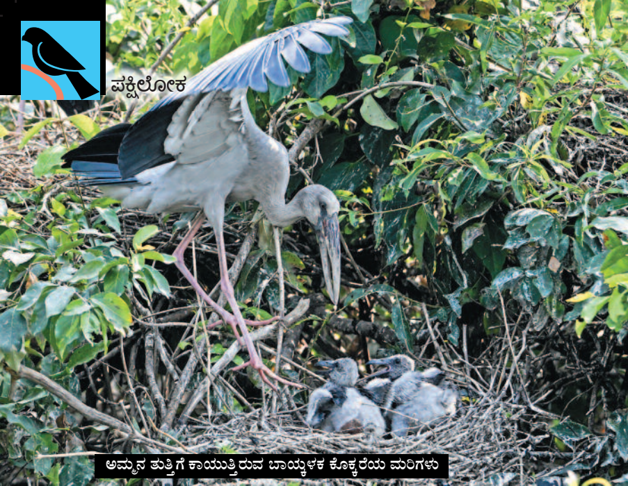
ಅಮ್ಮನ ಪುತ್ರಿಗೆ ಕಾಯುತ್ತಿರುವ ಬಾಯ್ಕಳಕ ಕೊಕ್ಕಲೆಯ ಮರಿಗಳು

ಜೋತು ಬಿದ್ದಿರುವ ನರಿ ಮುಖದ ಬಾವಲಿಗಳನ್ನು 'ಹಾರುವ ನರಿ' ಎಂದು ಕರೆಯಲಾಗುತ್ತದೆ' ಎನ್ನುತ್ತಾರೆ ಆರ್‌ಎಫ್‌ಒ ಸೈಯದ್ ನದೀಂ.