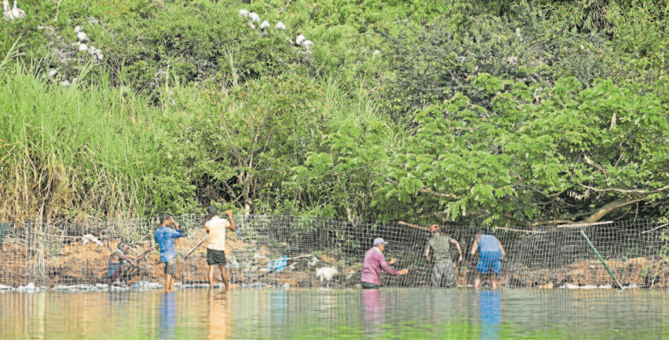
ದ್ವೀಪಗಳ ಸಂರಕ್ಷಣೆಗಾಗಿ 'ಗೇಬಿಯಲ್ ಸ್ಪ್ರಿಂಗ್ಸ್' ಮಾದರಿಯ ತಡೆಗೋಡೆ ನಿರ್ಮಿಸಲು ಜಾಲರಿ ಅಳವಡಿಸುತ್ತಿರುವ ಕಾರ್ಮಿಕರು