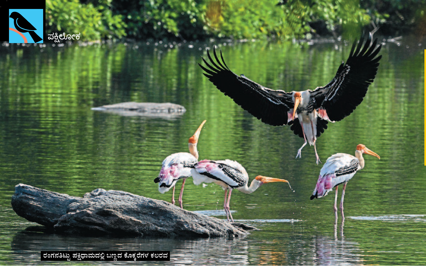
ರಂಗನತಿಟ್ಟು ಪಕ್ಷಿಧಾಮದಲ್ಲಿ ಬಣ್ಣದ ಕೊಕ್ಕರೆಗಳ ಕಲರವ