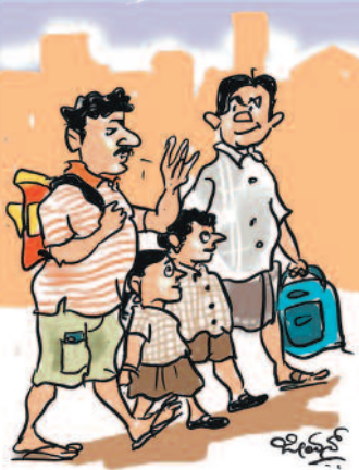
ಹೊಸ ಶಾಲೆ ತೆರೆಯುವಾಗಲೇ ಶೌಚಾಲಯ ಕಡ್ಡಾಯ ನಿಯಮ ಮಾಡಿದ್ದ ಈ ಖರ್ಚು ಇರೋಲ್ಲ!