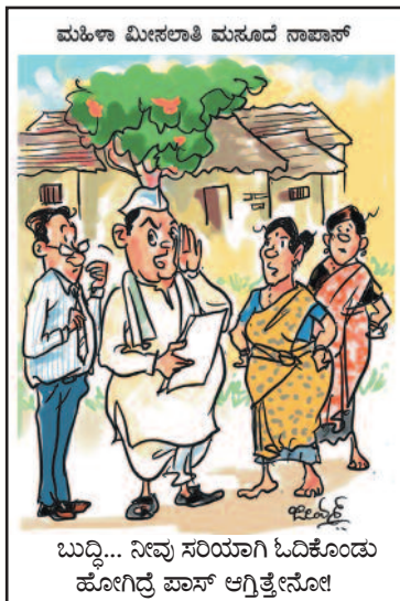
ಬುದ್ಧಿ... ನೀವು ಸರಿಯಾಗಿ ಓದಿಕೊಂಡು ಹೋಗಿದ್ದ ಪಾಸ್ ಆಗುತ್ತೇನೋ!