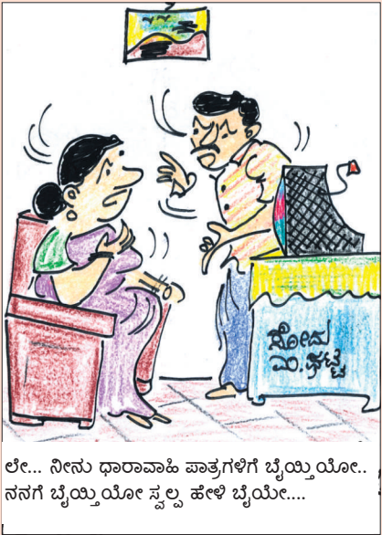
ಲೇ... ನೀನು ಧಾರಾವಾಹಿ ಪಾತ್ರಗಳಿಗೆ ಬೈಯಿಯೋ... ನನಗೆ ಬೈಯಿಯೋ ಸ್ವಲ್ಪ ಹೇಳಿ ಬೈಯೋ...