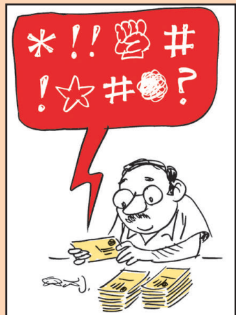
ಜಗತ್ತಿಗೇ ಅರ್ಥವಾಗದ ಲಿಪಿಯಲ್ಲಿ!