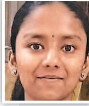
ಸೃಷ್ಟಿ 8ನೇ ತರಗತಿ, ವಿಜಯ ವಿಠಲ ವಿದ್ಯಾಶಾಲಾ ಮೈಸೂರು