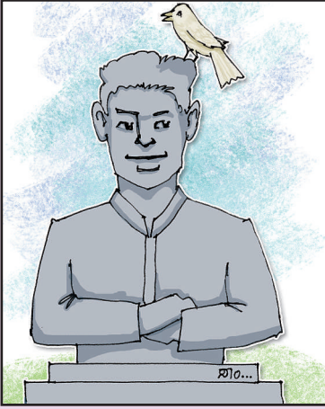
ಮಲಗಿಸಿದರೆ ಚೆನ್ನಾಗಿ ಕಾಣುವುದಿಲ್ಲವೆಂದು!