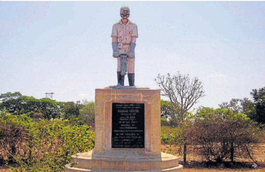
ಚಿನ್ನದ ಗಣಿಗಾರಿಕೆಯ ಕಾರ್ಮಿಕನ ಪ್ರತಿಮೆ