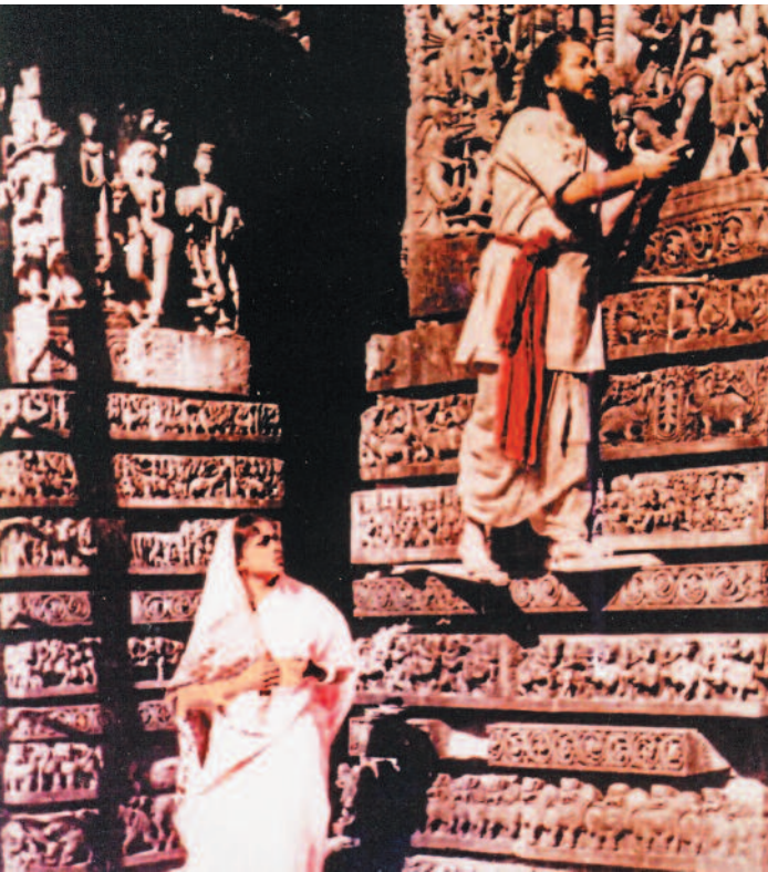
ಅಮರಶಿಲ್ಪಿ ಜಕಣಾಚಾರಿ: ಕಲ್ಯಾಣಕುಮಾರ್, ಸರೋಜಾದೇವಿ

ಕನ್ನಡ ಚಿತ್ರರಂಗ ನಡೆದುಬಂದ ಸಿನಿಮಾ ಪಯಣದ ದಾರಿಯನ್ನು ನೋಡಿದರೆ, ಹೂವು ಮತ್ತು ಮುಳ್ಳು ಎರಡೂ ಕಾಣಿಸುತ್ತವೆ.