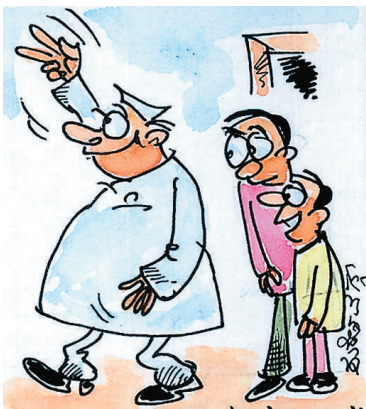
ಸಚಿನ್ ಶತಕಗಳ ಶತಕ ಗಳಿಸುವುದಕ್ಕೆಂತ ವೇಗವಾಗಿ ಇವರು 100 ಹಗರಣಗಳನ್ನು ಮಾಡಿದ್ದಾರೆ!