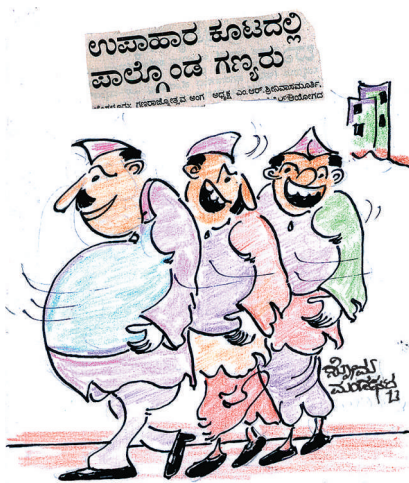
ನಾಳೆ ಭಿಕ್ಷುಮತದ ಲ ಬಿಟ್ಟು ನಿನಗೆ ಭಿಕ್ಷುಕರ ಊಟ ಇದೆ.. ರಕ್ಷಿಸಿಕೊಳ್ಳು ಬುದ್ಧಿವಂತೆ..!