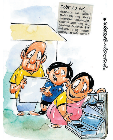
ಅದು ನಳದಲ್ಲಿ ಬರುತ್ತೆ ಅಂತ ಅಮ್ಮ ಕಾಯಿದಾಳೆ ಪವ್ವಾ..!