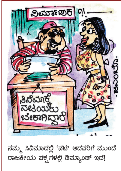
ನಮ್ಮ ಸಿನಿಮಾದಲ್ಲಿ 'ನಟಿ' ಆದವರಿಗೆ ಮುಂದೆ ರಾಜಕೀಯ ಪಕ್ಷಗಳಲ್ಲಿ ಡಿಮ್ಯಾಂಡ್ ಇದೆ!

ಅಮ್ಮಾ ಈ ವರ್ಷ ತ್ರಿಶ್ಚು ಪತ್ರಿಕೆ ಬಯಲಾಗಿ ನಿನ್ನ ಖಿಲತಾರಿ ಸ್ವೀಕರಿಸಿ ಹೀಗಿದೆ!..