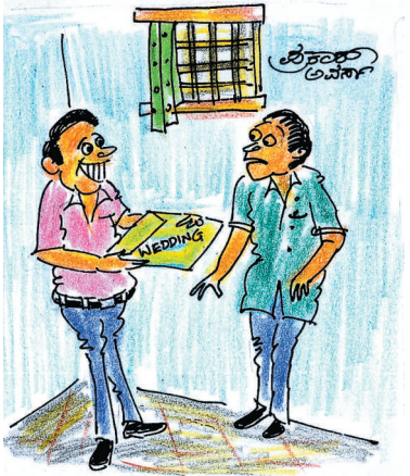
ಈಗಿನ ದೊಡ್ಡ ಲಗ್ನ ಪತ್ರಿಕೆ; ಮದುವೆ ಮನೇಲಿ ಊಟಕ್ಕೆ ತಟ್ಟೆ ಸಿಗದಿದ್ದಲ್ಲಿ ಇವುಗಳ ಮೇಲೆಯೇ ಬಡಿಸಿಕೊಂಡು ಊಟ ಮಾಡಬಹುದುರೇ..!