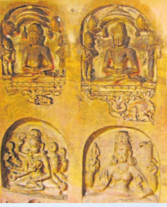
ಜೈನ ತೀರ್ಥಂಕರರು ಮತ್ತು ದೇವತೆಗಳ ಕೆತ್ತನೆ.