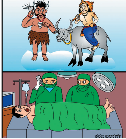
ಆವರೇಷನ್ ಪ್ರಾರಂಭವೇ ಮಾಡಿಲ್ಲ ಆಗಲೇ ಬರುತ್ತೇವೆಂದು ಫೋನ್ ಮಾಡಿ ಅವನರ ಮಾಡಿದರೆ ಹೇಗೆ ಯಮಕಿಂಕರಾ?