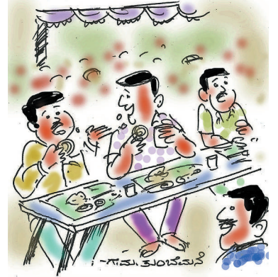
ಮದುವೆಯಲ್ಲಿ ನಾಲ್ಕಕ್ಕಿಂತ ಹೆಚ್ಚು ಲಾಡು, ಹೋಳಿಗೆ, ಜಿಲೇಬಿ ತಿನ್ನುವವರಿಗೆ ಟ್ಯಾಕ್ಸ್ ಹಾಕಿದ್ದೆ ಏನು ಮಾಡೋದು ..